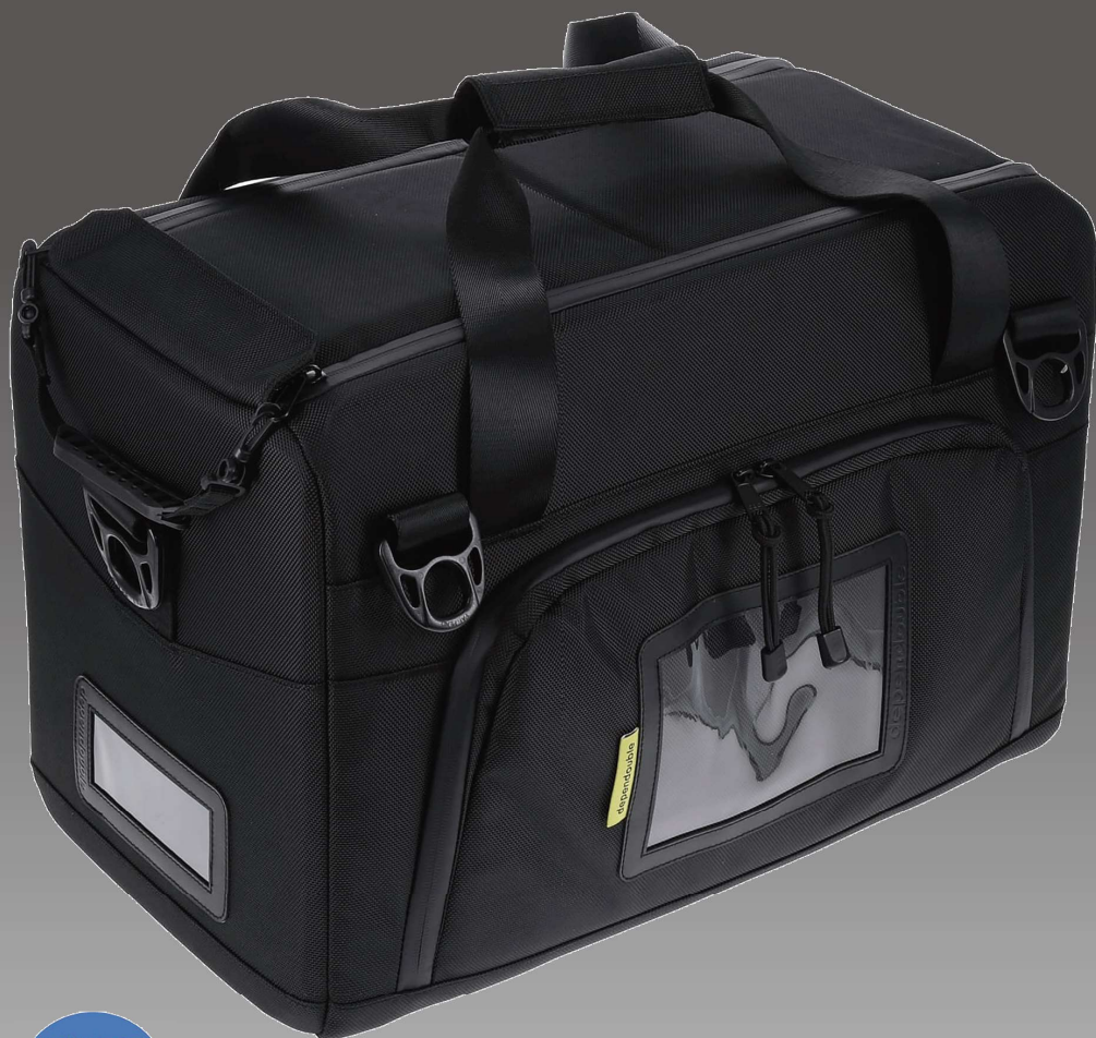
<フロントポケット>